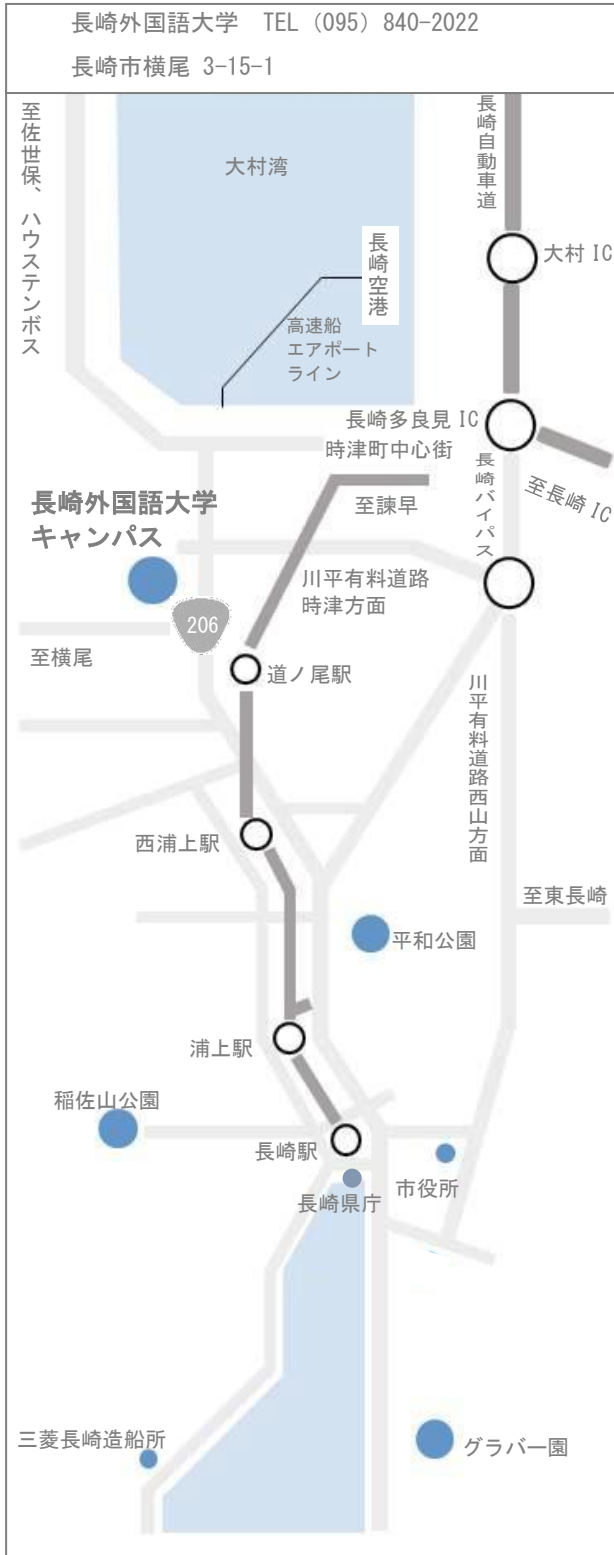
キャンパス周辺拡大図