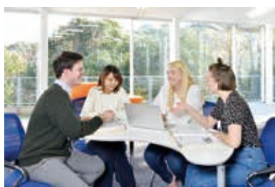
留学生との協働・共修の更なる充実は今中期計画の柱の一つ

今後5年間、本学は、本中期計画の21の戦略及び実施施策（アクション・プラン）を基に、その目指すところを各年度の事業計画等に更に落とし込み、全教職員一体となって、計画の実現、ひいてはビジョンの達成に向けて努力していく所存です。