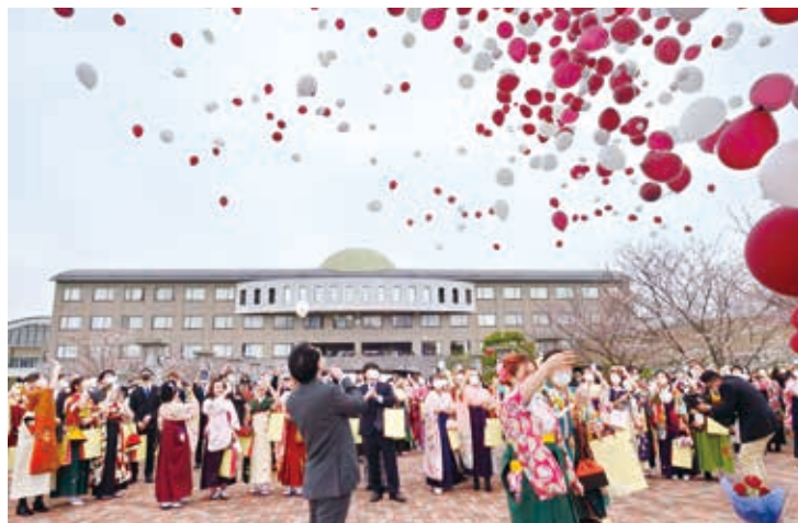
バルーンリリース

「3・2・1… 卒業おめでとう」の声と共に放たれた2,500個のバルーン。 3月19日に実施した2020年度卒業式のひとつです。新型コロナウイルス感染症拡大防止のため、やむを得ず中止した卒業パーティーに代え、昨年度に引き続きキャンパスでバルーンリリースを実施しました。 当日は風向きも良く、卒業生たちは空高く舞い上がったバルーンをいつまでも目で追いかけていました。