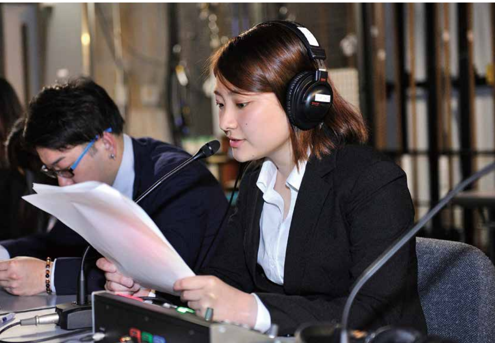
写真：2018年度春季入学式にて、英語同時通訳を務める学生