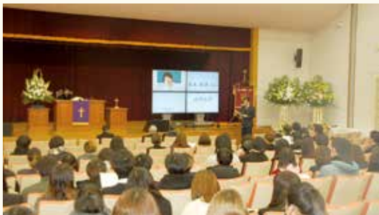
1月29日、卒業生や生前のご友人など多くの方のご列席を賜り、追悼礼拝を執り行いました。