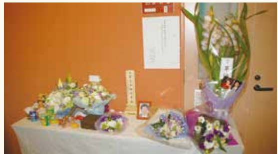
また、逝去をうけて急遽、先生の研究室前に設けられた献花台には、在学生や卒業生から毎日のように献花とお供え物が絶えませんでした。