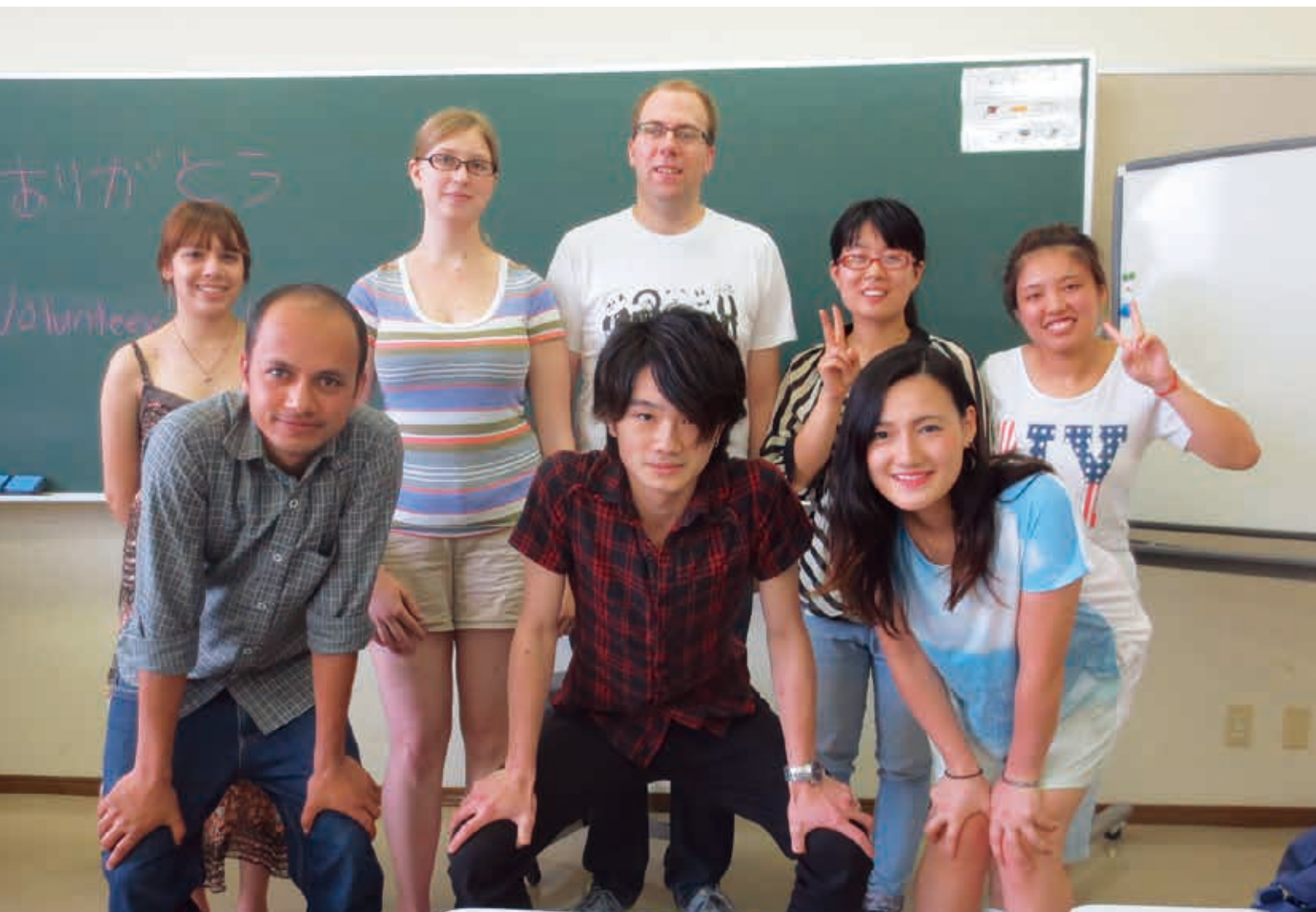
写真：アンペロス寮RA（レジデント・アシスタント）ミーティングにて