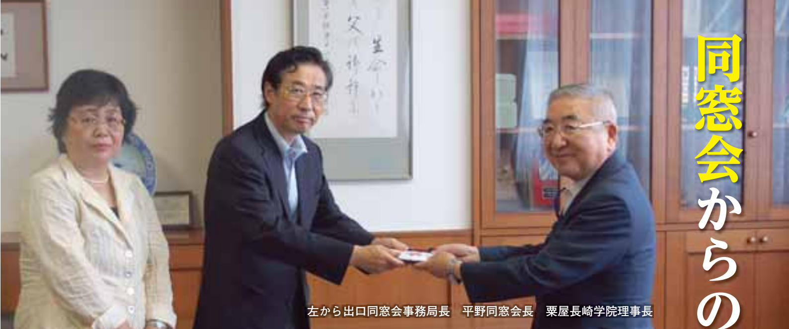
左から出口同窓会事務局長 平野同窓会長 栗屋長崎学院理事長