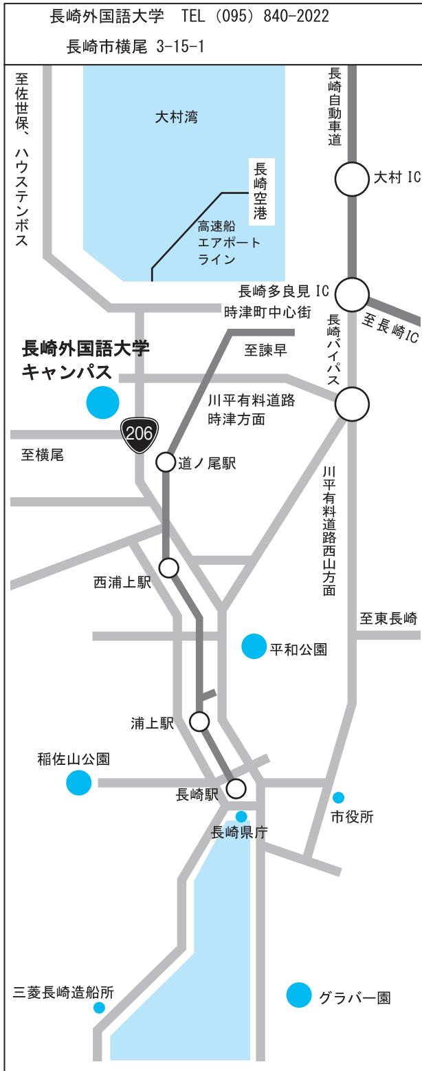
キャンパス周辺拡大図